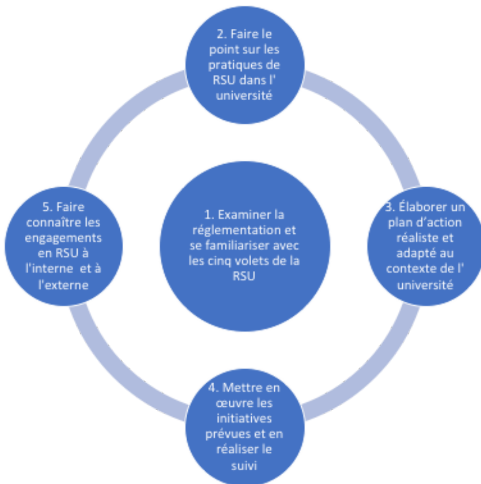
Figure 2: Les cinq étapes d'une démarche de RSU

Il ne s'agit donc pas de mettre ce guide de côté une fois sa lecture terminée, mais plutôt de le conserver à portée de main pour penser périodiquement la démarche de RSU de l'université et la mûrir dans une logique d'amélioration continue.