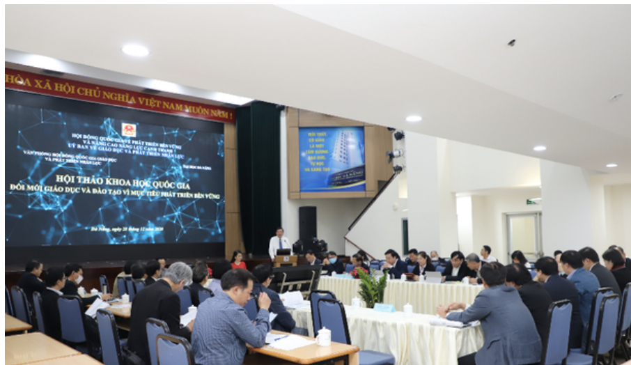
Figure 1 : Aperçu de la conférence

Mais ce n'est pas tout! Le 28 décembre 2020, l'Université de Da Nang a également été l'hôte d'une conférence scientifique nationale intitulée « Innovating education and training for the goal of sustainable development » (innover en éducation et en formation pour le développement durable). Durant cette conférence, plusieurs éléments ont été soulignés : les rôles et l'importance de l'éducation et de la formation dans l'atteinte des objectifs de développement durable, mais aussi le fait que les institutions d'éducation sont des lieux privilégiés pour exprimer et réaliser les orientations et les politiques du gouvernement à cet égard.